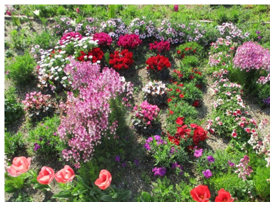
おんが病院 屋上庭園